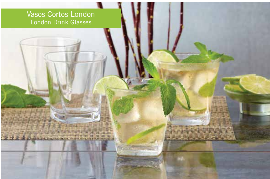
Vasos Cortos London London Drink Glasses

Disponibles en juegos de 4. Available in sets of 4.