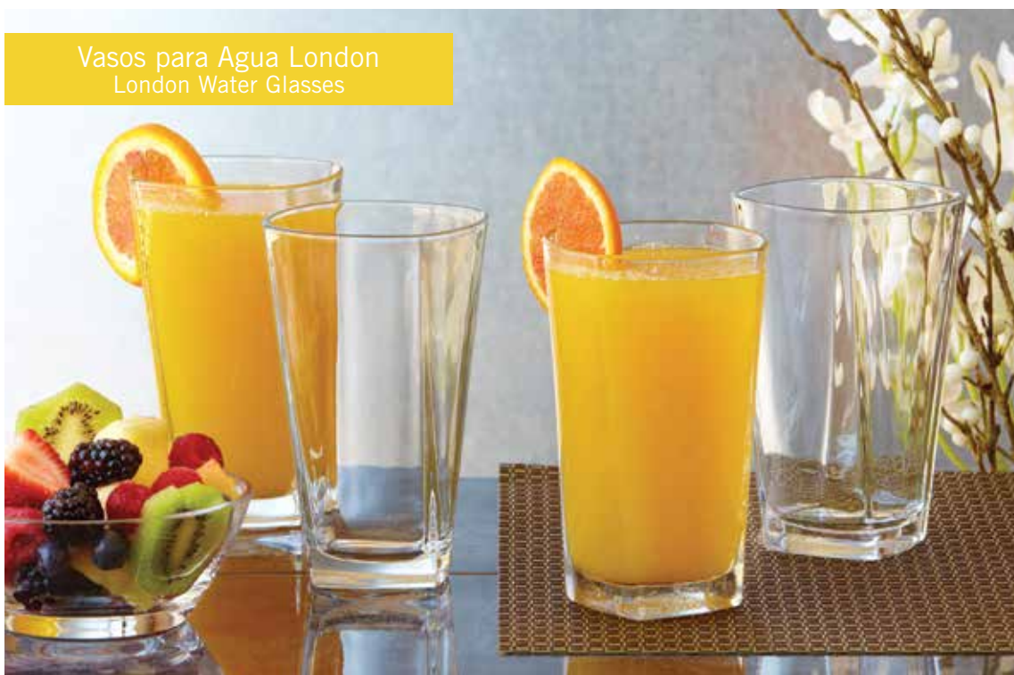
Vasos para Agua London London Water Glasses

Disponibles en juegos de 4. Available in sets of 4.